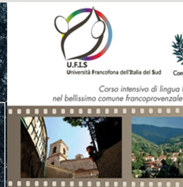
Luglio UGFIS a