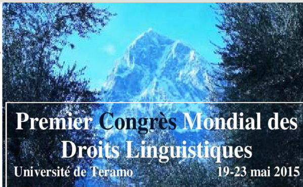
Giugno Lancio Primo Congresso Mondiale Diritti Linguistici